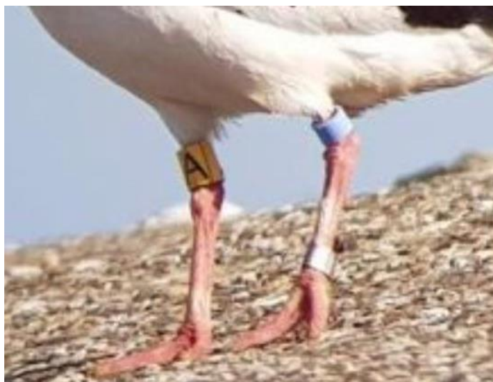
TLP-YA (Top Left Paleblue - Yellow A)