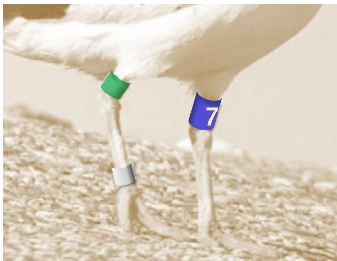
TRG-C7 (Top Right Green - Cyaan 7)